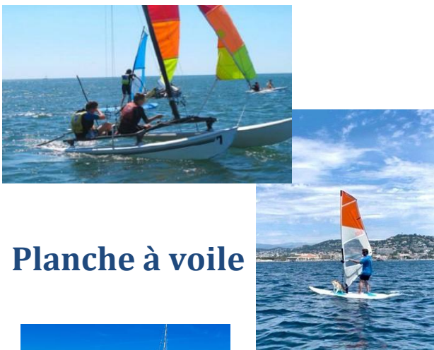
Planche à voile